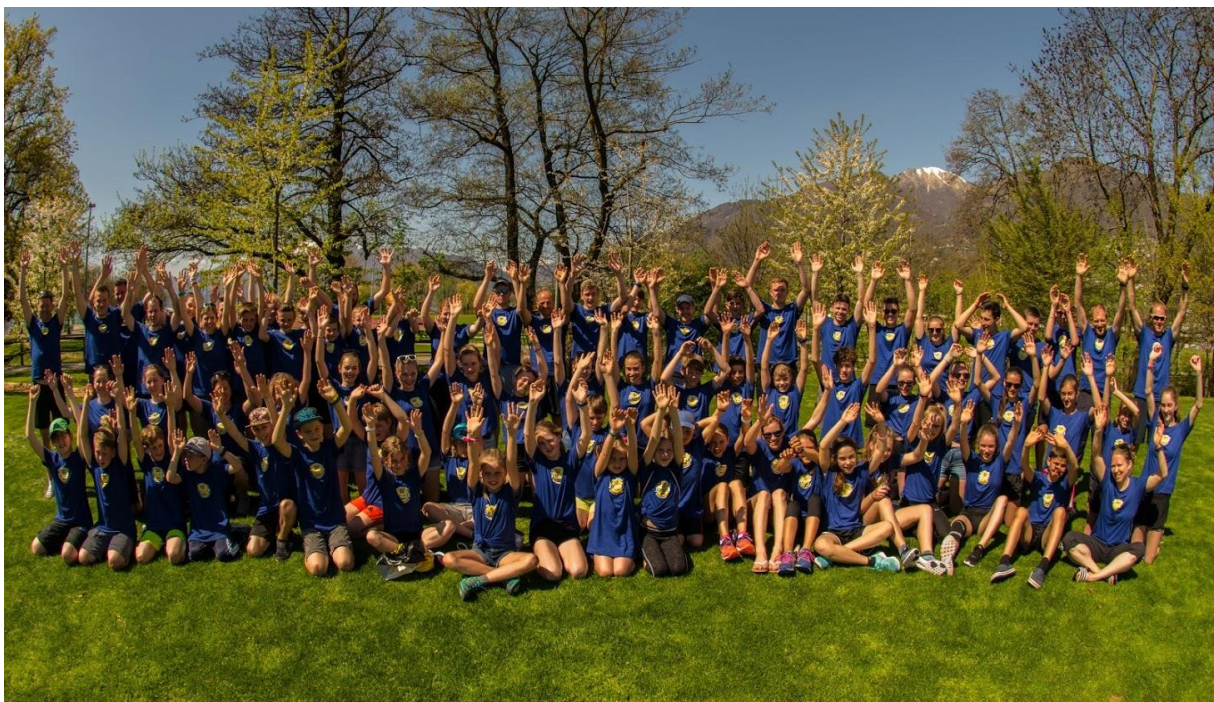
Der TSVF in Tenero bei Spitzenwetter (wie immer!;-) im April 2018